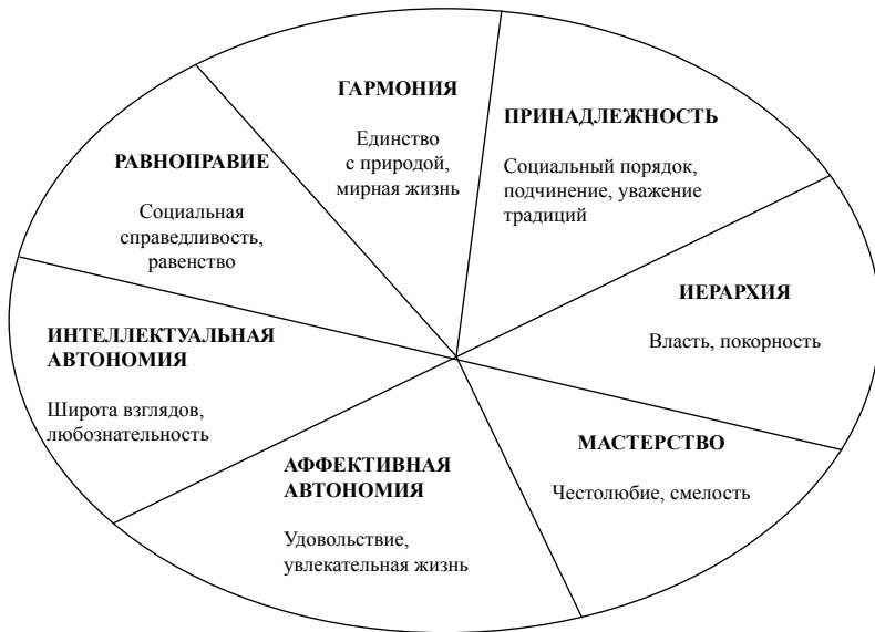
Рис. 2.1. Культурные ценностные ориентации: теоретическая структура (Schwartz, 2004)

индивидуальную ответственность за свои поступки и принимать решения на основе их личного понимания ситуации. Высокий уровень Равноправия и Интеллектуальной Автономии обычно одновременно присутствует в культурах Западной Европы. Принадлежность и Иерархия сходятся в предположении, что роли и обязательства личности по отношению к коллективам важнее, чем ее уникальные идеи и стремления. Сходные и различающиеся предположения, скрытые в культурных ценностях, формируют согласованную круговую структуру отношений между ними. Соседние сегменты круга — это согласующиеся ценности, дальние — противоположные по смыслу.