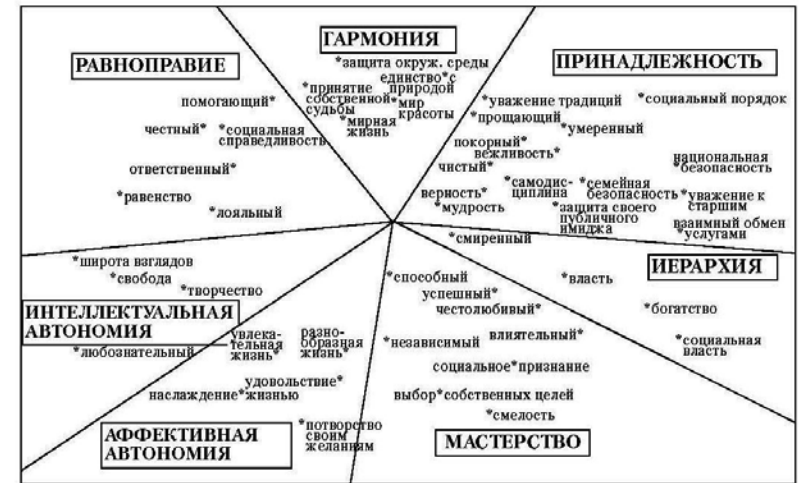
Рис. 2.2. Культурный уровень анализа: результаты многомерного шкалирования, 233 выборки, 81 культурная группа (Шварц, 2008)

Так же, как Хофстед и Инглхарт, Шварц выделил типичные для каждого общества культурные ценностные ориентации путем усреднения ценностных приоритетов людей в выборках каждой культуры. Теория культурных ценностных ориентаций Шварца прошла проверку на 233 выборках (72 страны и 81 культурная группа).